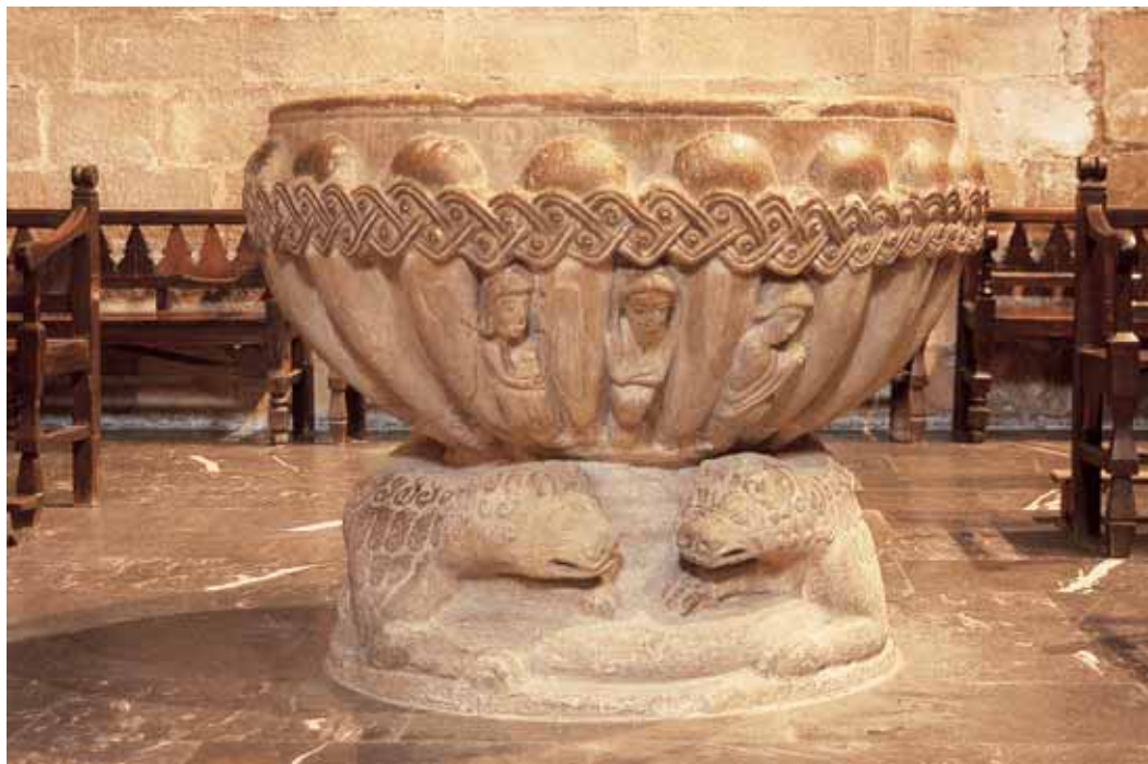
Sarcófago medieval y pila bautismal. Abajo, cruz procesional del siglo XVIII.

fábrica románica, solamente se conservan las tres naves a partir del crucero, que constituyeron la planta de tipo basilical propia de las iglesias de aquella época.