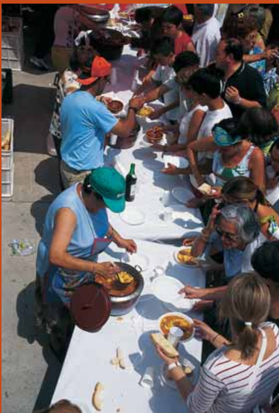
De arriba a abajo, participantes en un concurso de ollas; atizando el fuego con fuelle; y, el público da buena cuenta del guiso.